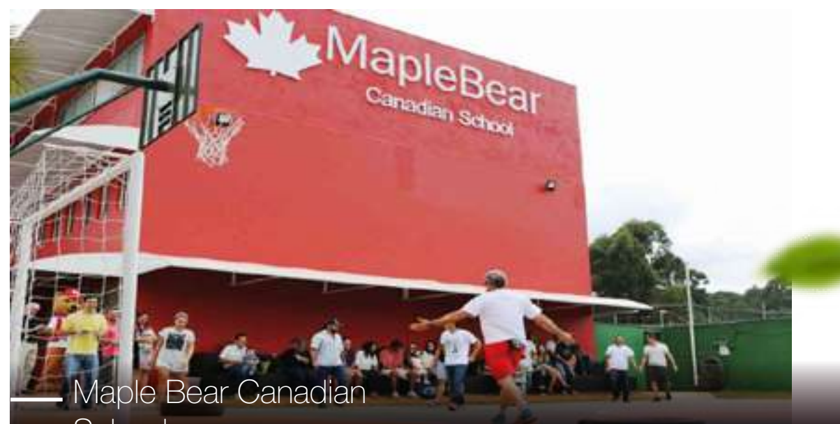
Maple Bear Canadian School