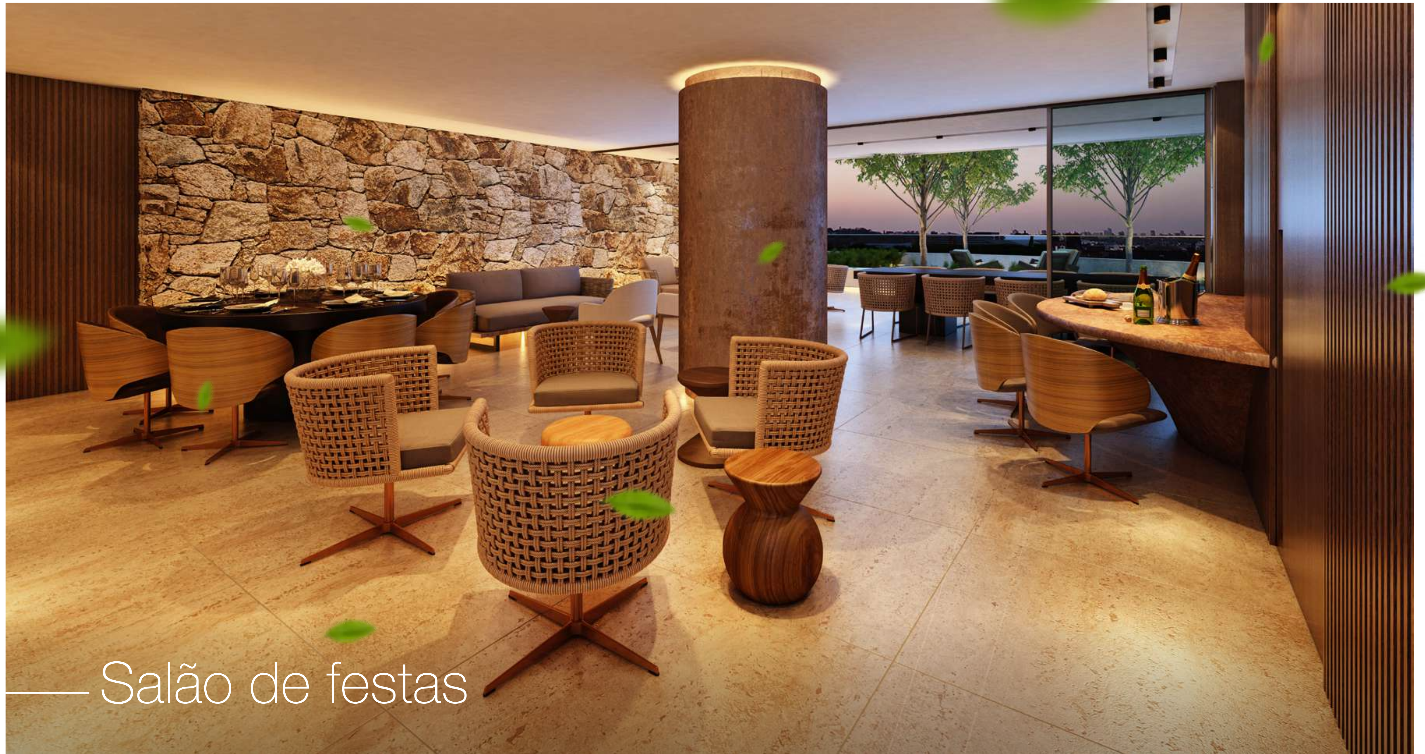
— Salão de festas