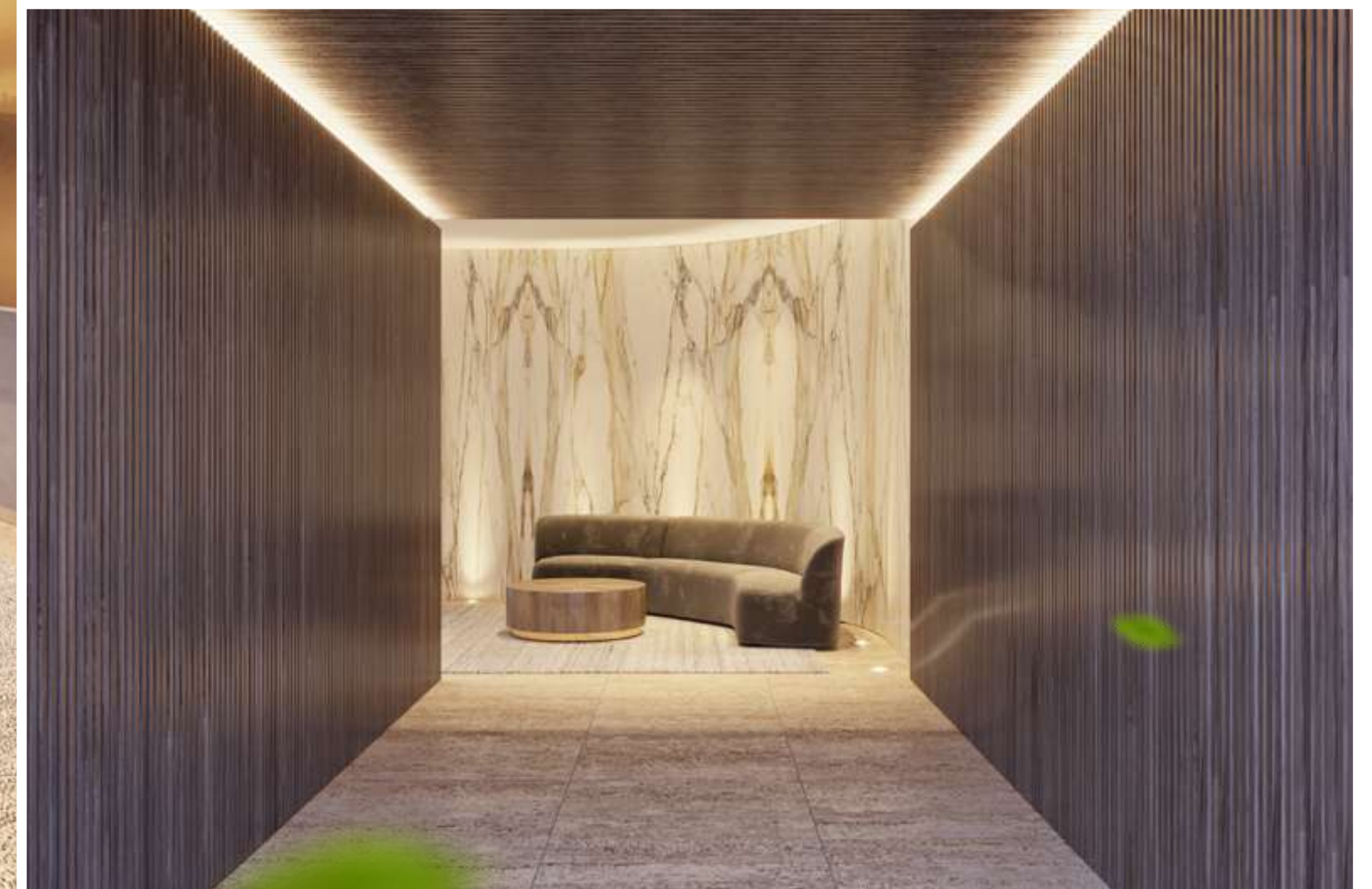
Hall de entrada