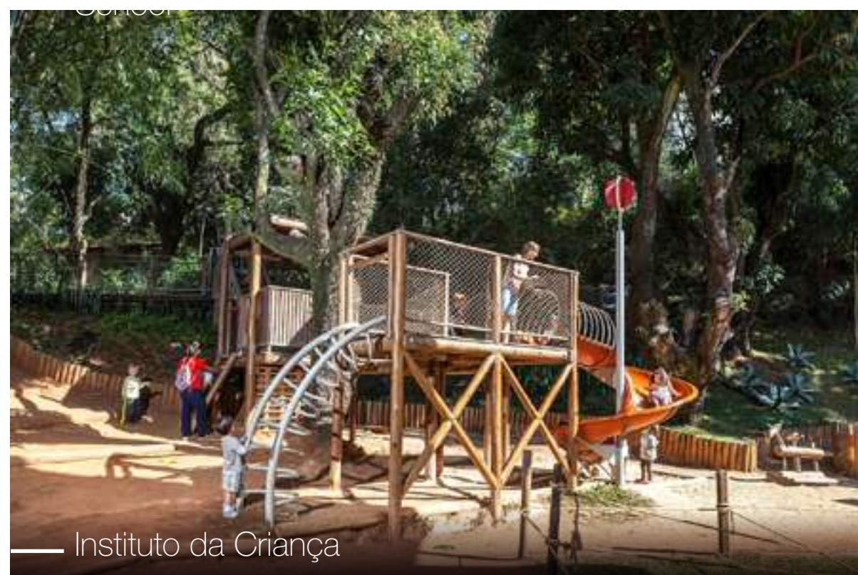
Instituto da Criança

É a melhor opção para quem busca bem-estar, mas não abre mão da tranquilidade.